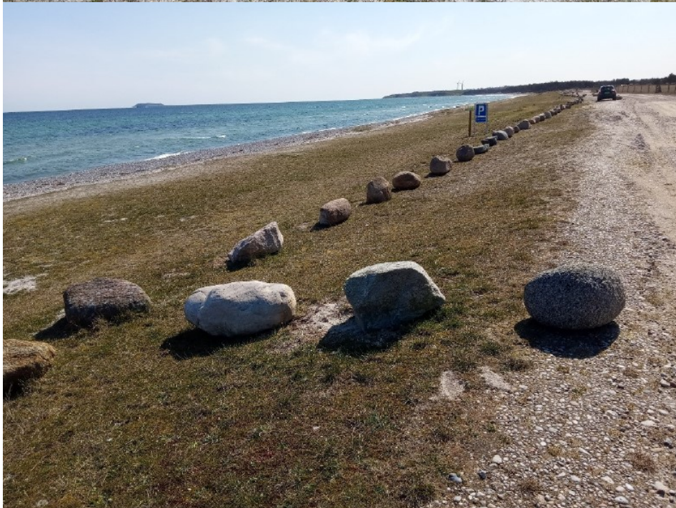
Figur 2, billeder fra ansøgningen, der viser sten udlagt parallelt med vej og kyst