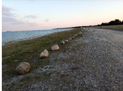
P- og infoskilte: